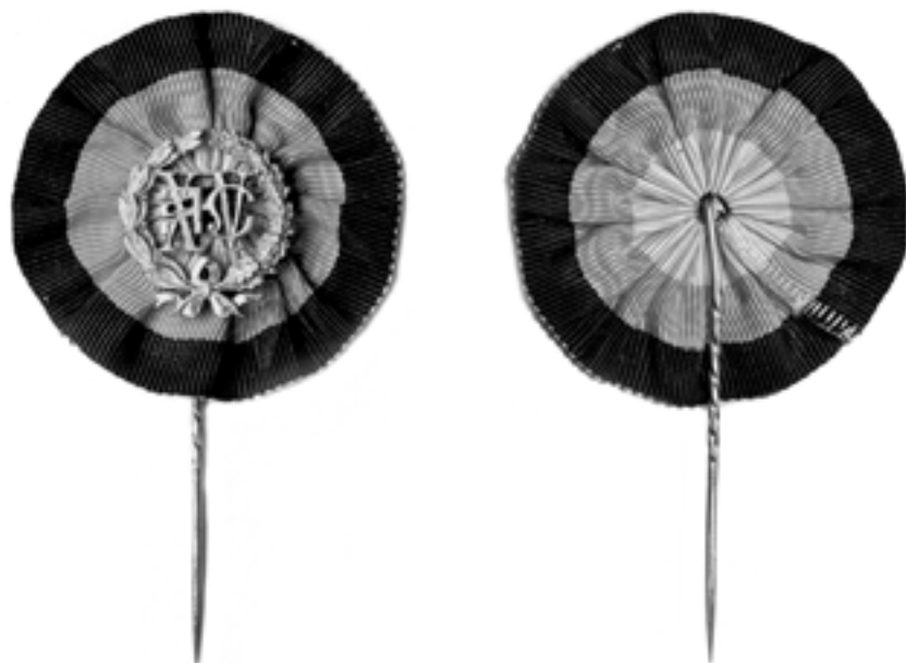
Рис. 2. Значок XV АС в Новгороде, принадлежавший графине П.С. Уваровой, цвета кокарды – черный, красный и белый (Отдел нумизматики ГИМ). Фото П.Г. Гайдукова, июль 2011 г.

ники останавливались в гостиницах, в том числе в лучшей в городе гостинице А.А. Соловьева на Московской улице (рис. 1).