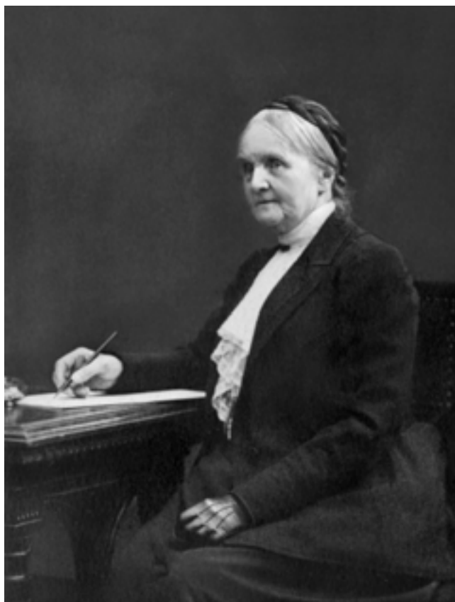
Рис. 5. Председатель XV АС в Новгороде графиня П.С. Уварова. Фото 1914 г.

Последовавшие после этого революционные события 1917 г и связанные с ними социальные изменения коренным образом изменили ход развития