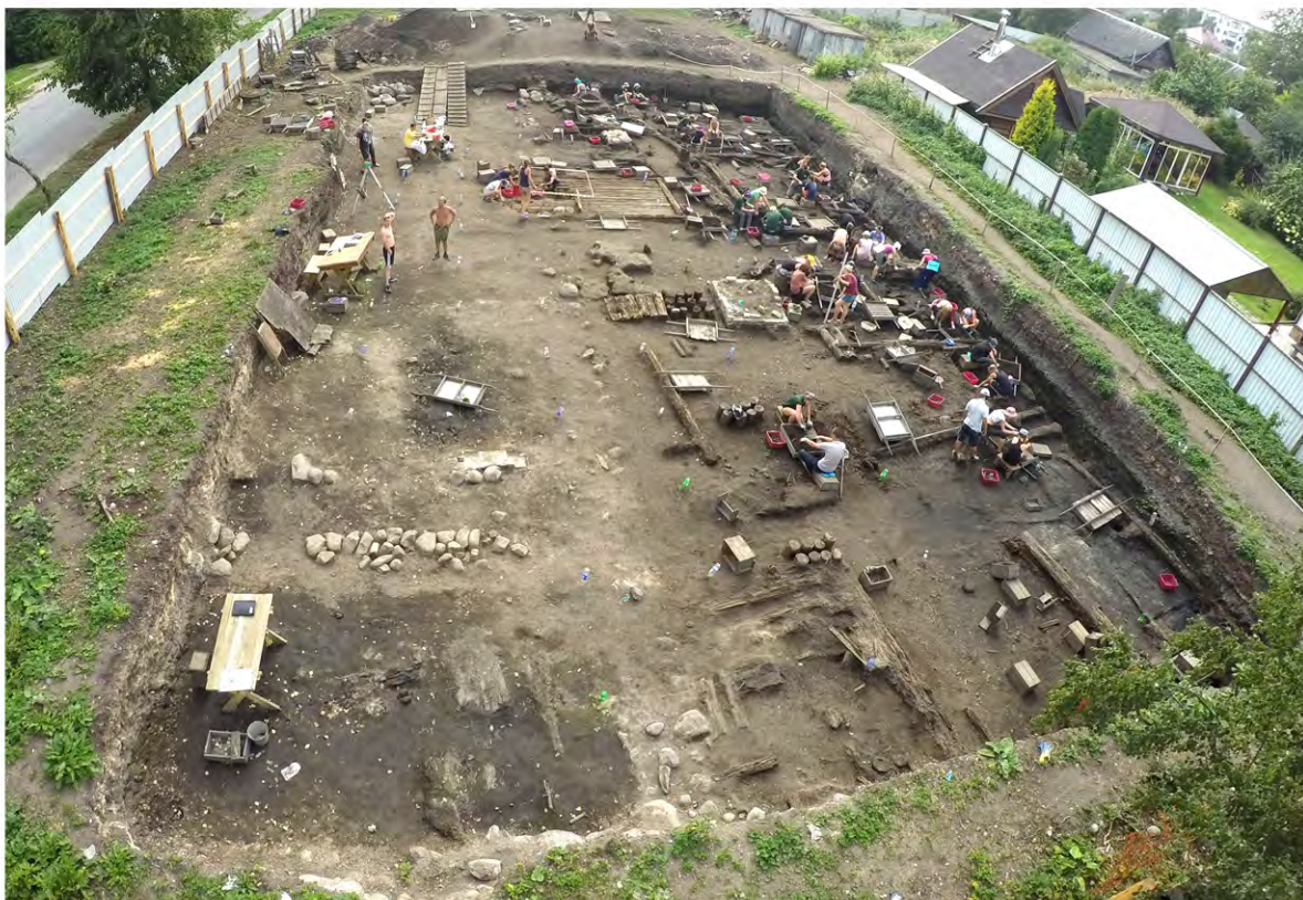
Рис. 2. Общий вид Троицкого XVI раскопа, вид с севера.

насухо, пространство между ними засыпано песком с битым кирпичом. На дно траншеи под валуны сначала были уложены деревянные продольные лаги. Для них использованы сосновые брёвна диаметром 22–25 см, подтёсанные с двух сторон под брус толщиной 16–18 см. В двух случаях зафиксированы стыки звеньев продольных лаг. Под ними были уложены поперечные подкладки из обрезков брёвен, также подтёсанных под брус. Они лежали группами по 4–5 подкладок. Между ними прослежены ряды свай, забитые в два ряда по четыре сваи. Под юго-западный угол было забито три ряда по четыре сваи. Диаметр брёвен для свай – 18–23 см. С одной из лаг под фундамент и подкладки под неё удалось получить следующие дендродаты – 1896 г.