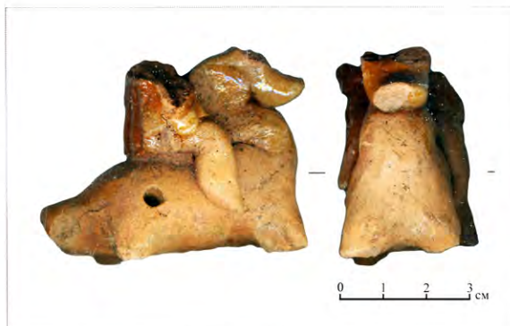
Рис. 8. Свистулька полевая, обл., глина

В целом вещевая коллекция Троицкого XVI раскопа представляет собой собрание разновременных предметов. Наряду со средневековыми изделиями XIV–XV вв. в ней в значительном количестве присутствуют разнообразные предметы XVIII–XIX вв. В их числе монеты (14), товарная пломба (Рис. 4: 4), глиняная игрушка-свистулька (Рис. 8), турецкая курительная трубка, помадные банки, нательные кресты (Рис. 5: 1; Рис. 7: 1).