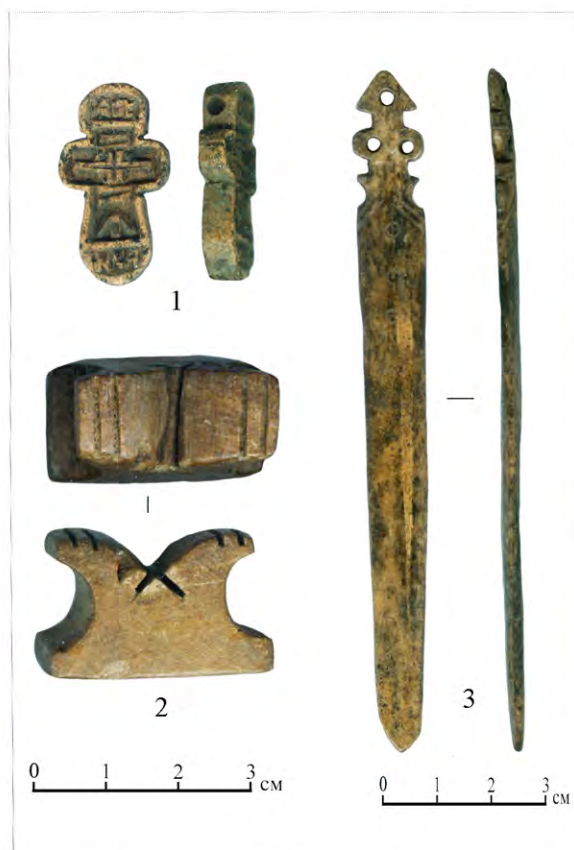
Рис. 7. Изделия из кости: 1 – крест нательный, верхний слой; 2 – фигурка шахматная, ладья; 3 – булавка

Большинство построек и конструкций этого яруса продолжают в пласте 3, поэтому они были законсервированы и будут исследованы в сезоне 2016 г.