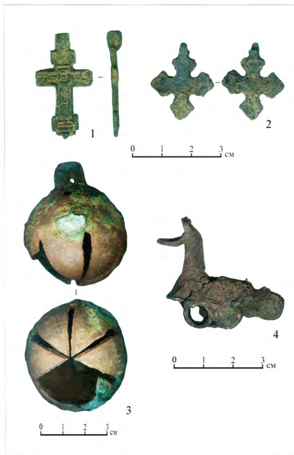
Рис. 5. Изделия из цветных металлов: 1–2 – кресты нательные (1 – бронза; 2 – свинец–олово); 3 – бубенчик упряжной, бронза; 4 – привеска зооморфная (конёк-амулет), обл., бронза

На границе кв. 2036 и 2037 был зафиксирован небольшой отрезок частокола длиной 0,6 м из свай диаметром 0,08–0,10 м. Частокол был сильно повреждён столбами фундамента сооружения ТС–XVI–2 яруса 0. Возможно, данная линия частокола разделяла две усадьбы: одну, выходящую на перекрёсток Редятиной и Пробойной улиц (исследуемую на площади раскопа), и другую, располагавшуюся на перекрёстке Воздвиженской и Пробойной улиц.