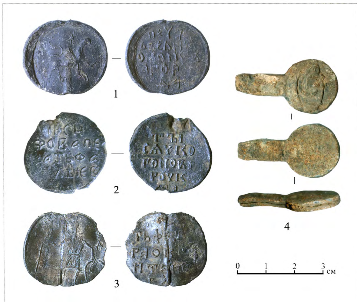
Рис. 4. Печати вислые и пломба товарная, свинец: 1 – печать Великого Новгорода; 2 – печать тысяцкого Есифа; 3 – печать Федора Оксентиева; 4 – пломба

второй половины XIV – первой половины XV вв. 4 Здесь же были найдены крупные фрагменты обмазки тигельной печи. По всей видимости, в конце XIV в. жители этой усадьбы занимались литейным делом.