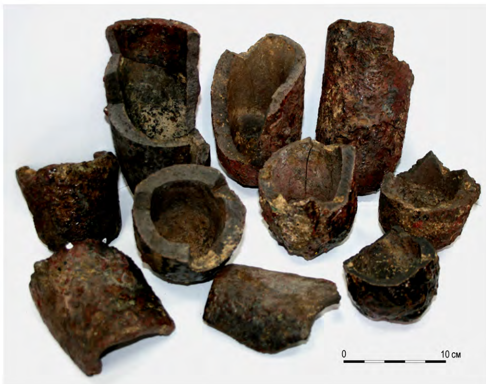
Рис. 3. Тигли плавильные, глина.

пределах раскопа составляют 6,0 \times 5,3 м. Сохранились нижние венцы северной и южной стены. Под северо-восточный и юго-восточный углы дома были подведены фундаментные подкладки из обрубков брёвен и плах. Одно из брёвен было расколото пополам, а полученные плахи были уложены под северо-восточный и юго-восточный углы дома. Фундаментные подкладки были использованы вторично из деталей построек предыдущего яруса, поскольку торцы брёвен обгоревшие и имеют несколько вырубков. Венцы сруба также несут на себе следы пожара. Внутри сооружения зафиксировано несколько обгоревших досок, которые, скорее всего, являются остатками пола. Доски ориентированы по линии запад–восток. Следов отопительного сооружения не зафиксировано. Возможно, оно располагалось в западной части дома, которая не попала в площадь раскопа.