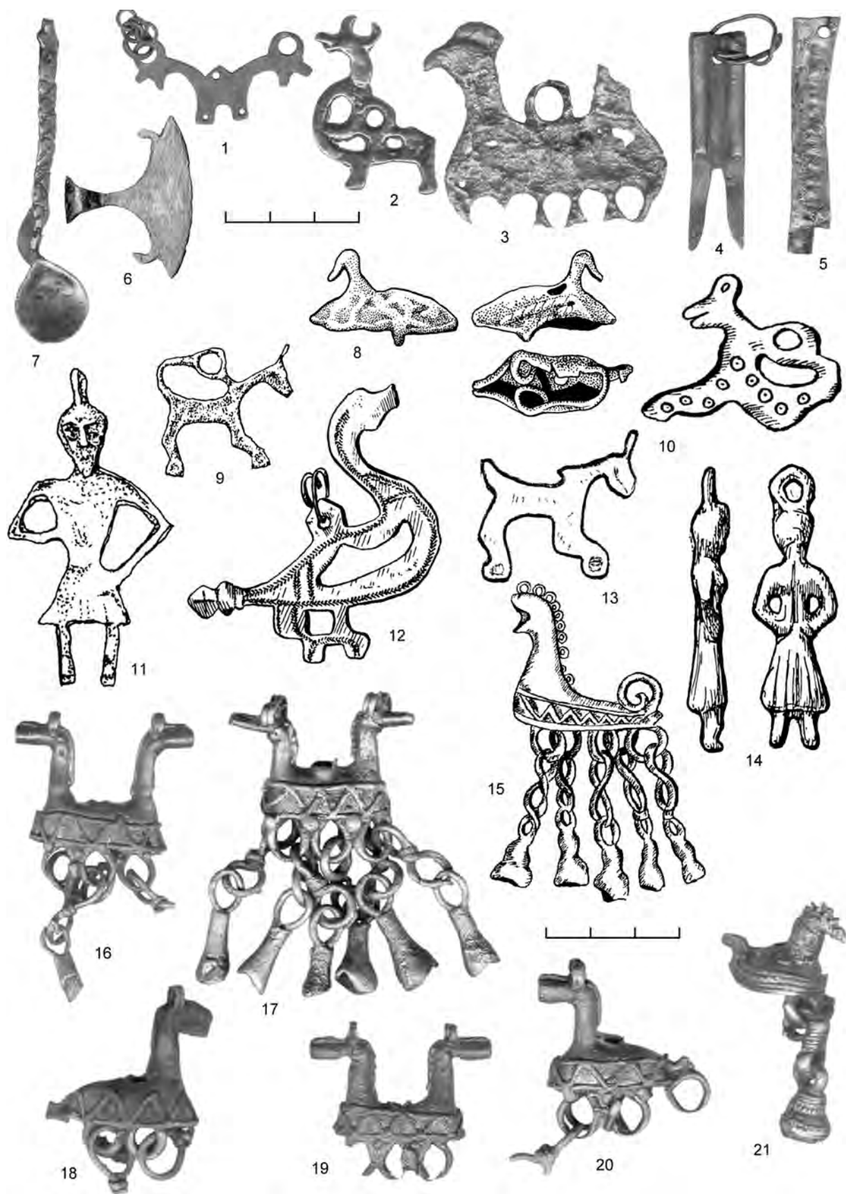
Рис. 2. Привески Троицкого (1-7, 9, 12, 14, 16-21) и Неревского (8, 10, 13, 15) раскопов. 1-14 — привески-амулеты; 15-21 — шумящие полые привески